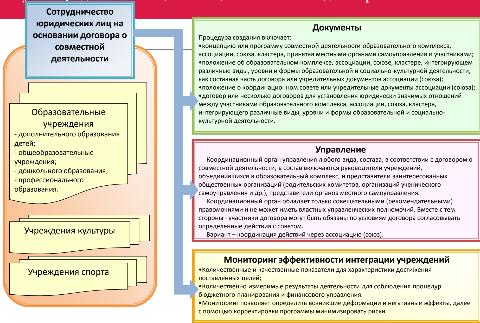
Схема организации взаимодействия разных учреждений и организаций со статусом юридических лиц на ассоциативной и/или договорной основе